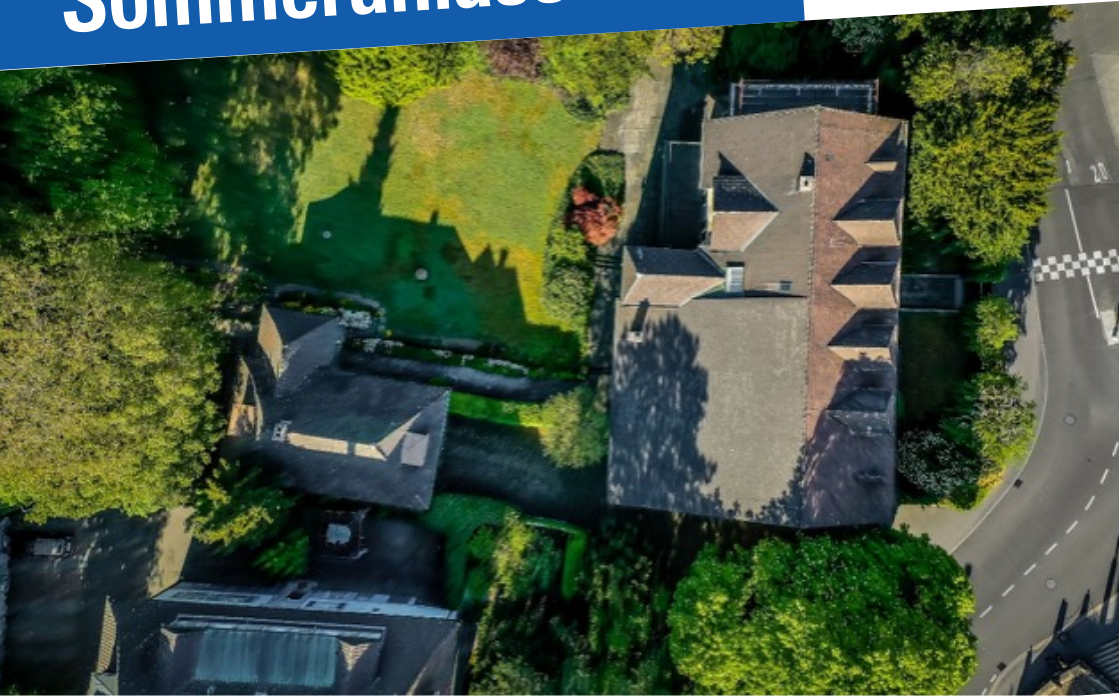
Däster Schild Haus vor der Renovation, 2022